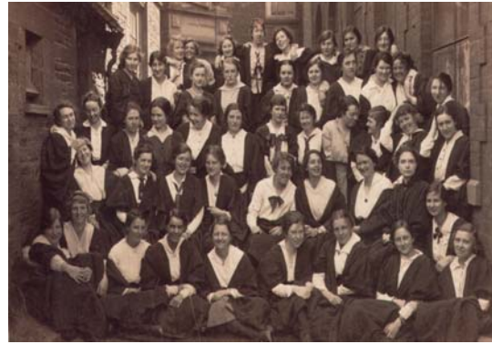
Myfyrwagedd, Prifysgol Caerdydd, geiriad ar y cefn – 'Old College, 1917'