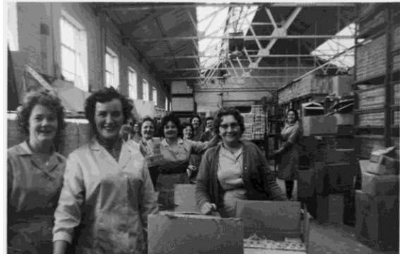
Aelodau o'r adran bacio ffatri Mettoy's, Fforest-fach, Abertawe, 1960au