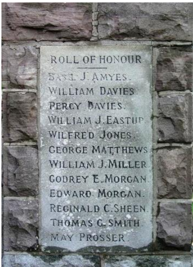
Mynediad i Gae Chwarae'r Brenin George V, Gofilon.